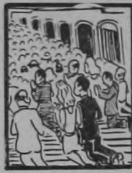
Para algunos no hubo maná.