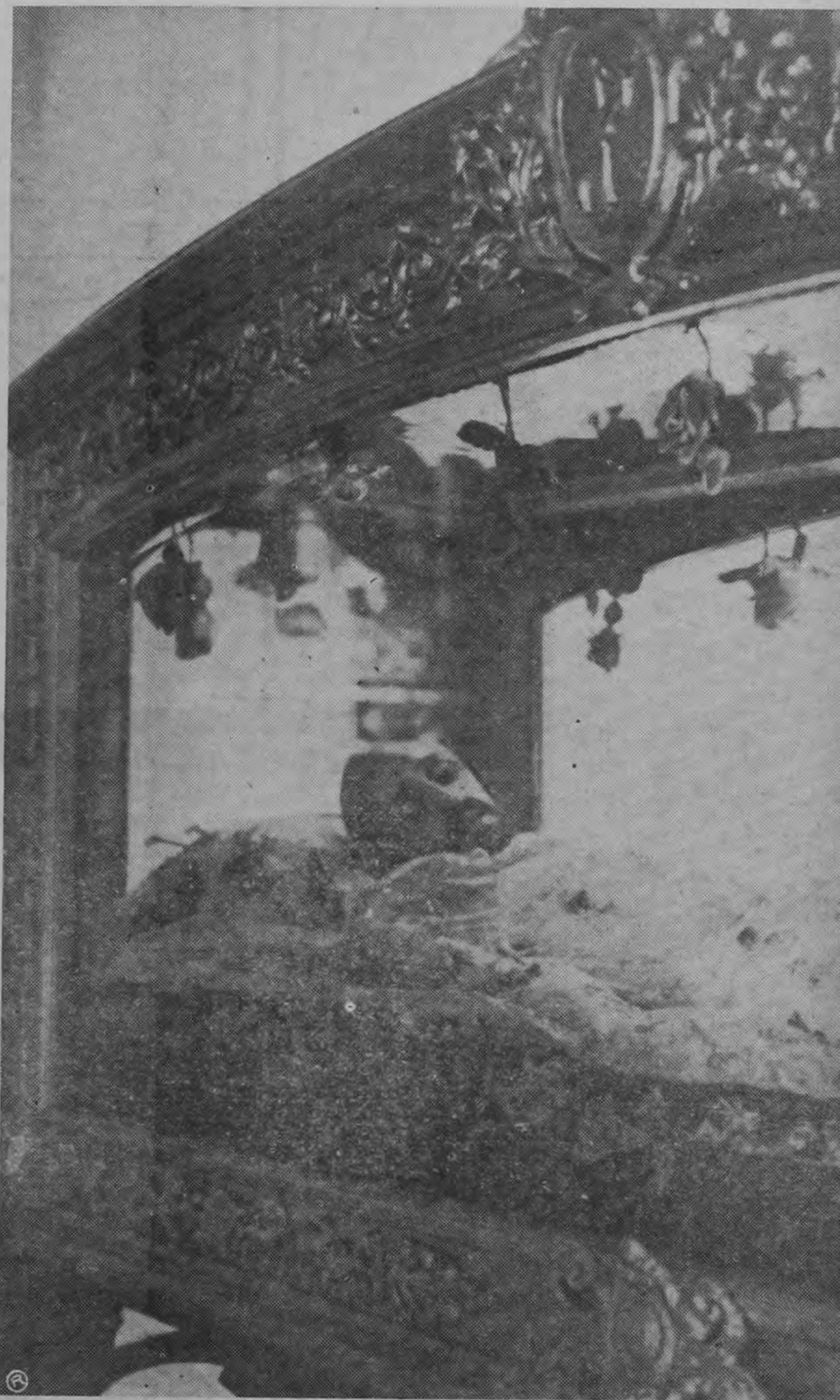
EL CRISTO YACENTE DE HEREDIA