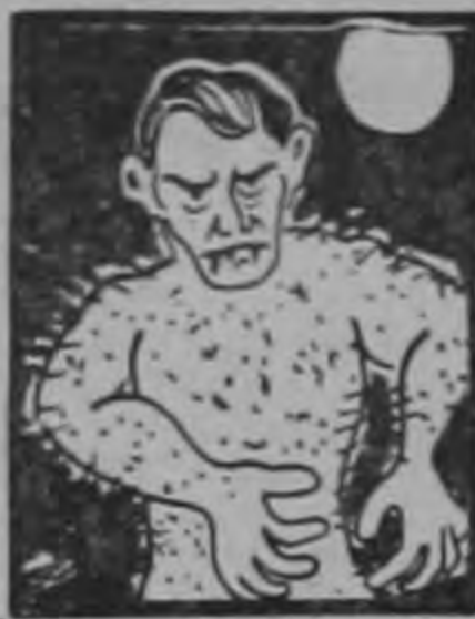
¿Otra vez el Hombre-Lobo?