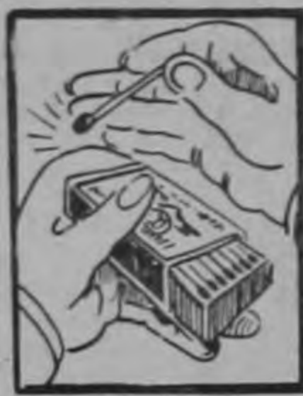
¿Quién pone fuego a la mecha?