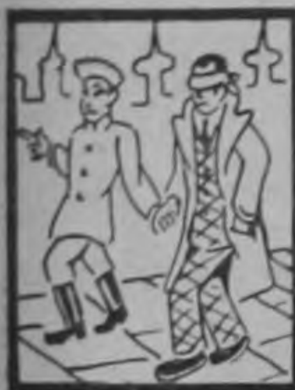
Tienen ojos y no verán...

Commemora la Cristiandad el primer día de la Pasión de Nuestro Señor Jesucristo.