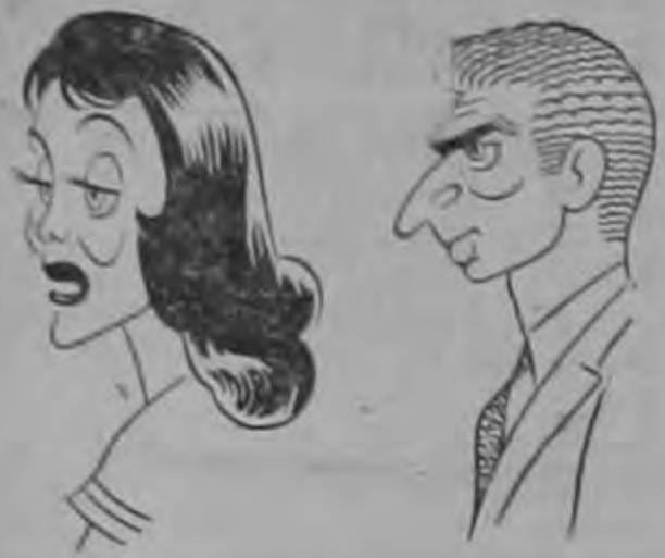
Loretta Young y Jeff Chandler