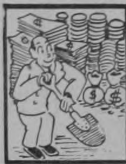
Cobranza en paleta.